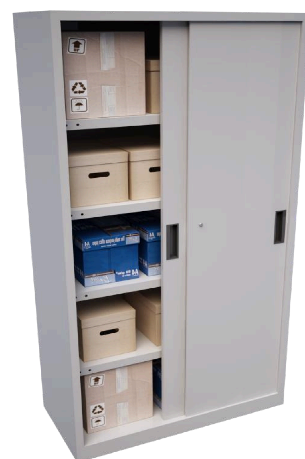
Armario con puertas correderas