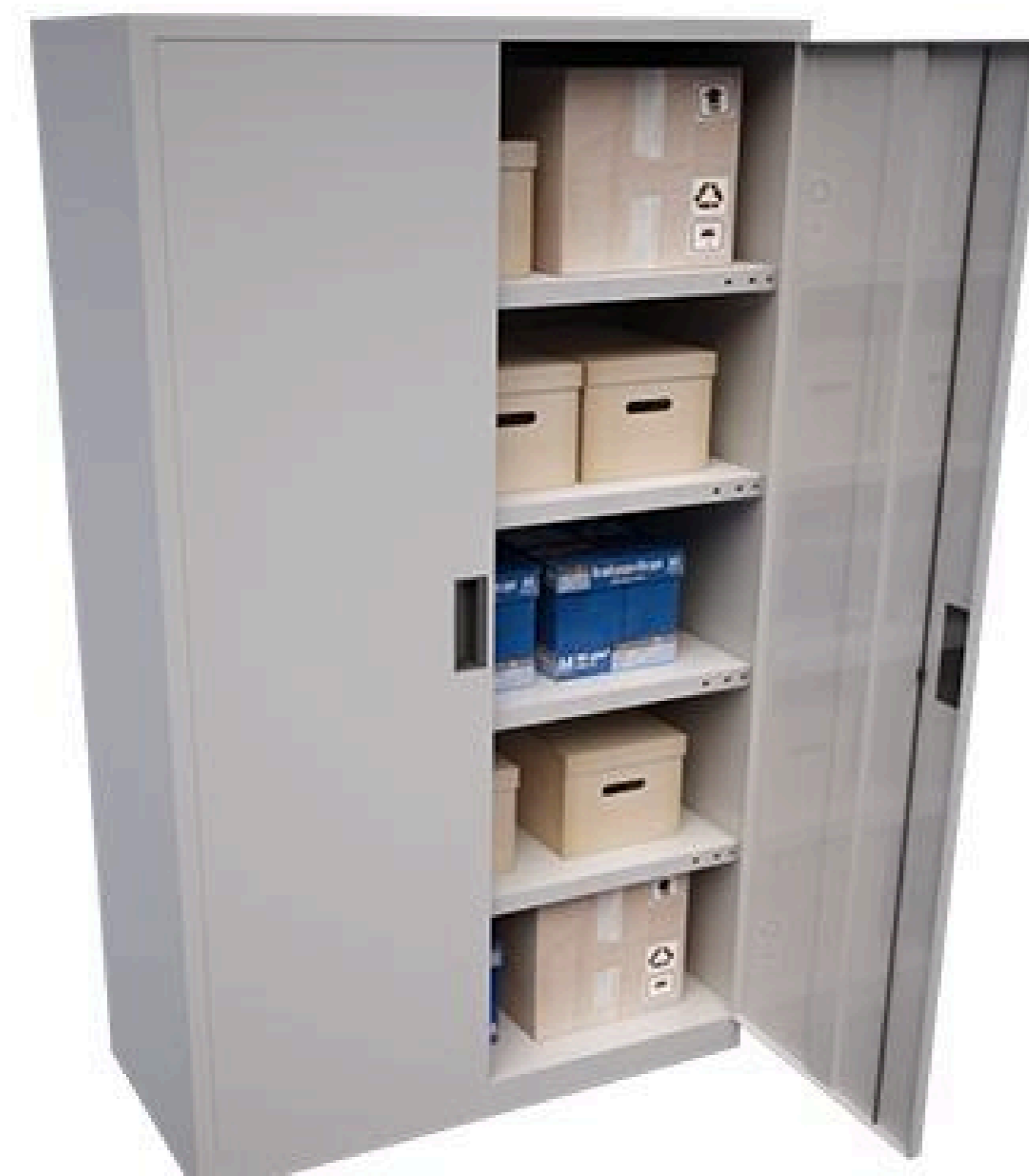
Armario con puertas abatibles