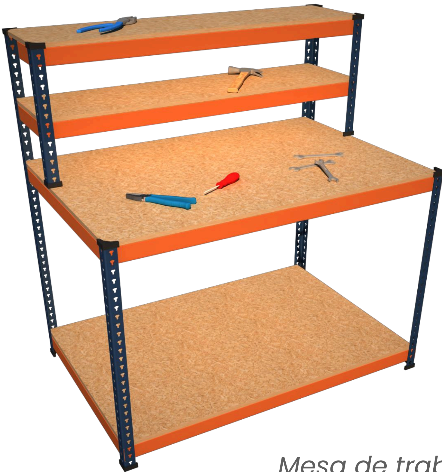
Mesa de trabajo

Escanea el código QR para saber más sobre las Mesas y Bancos de trabajo