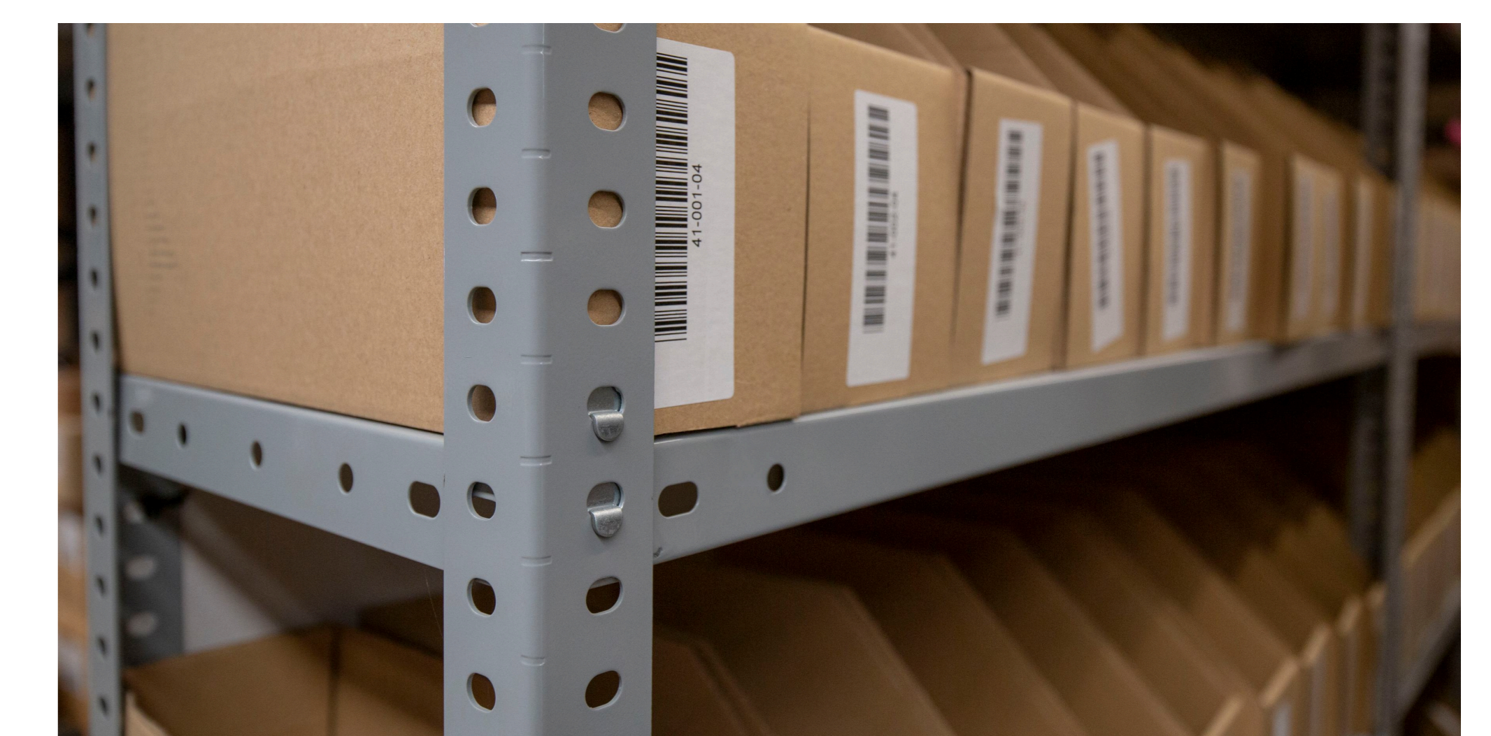
Detalle enganche de bandeja sin tornillos