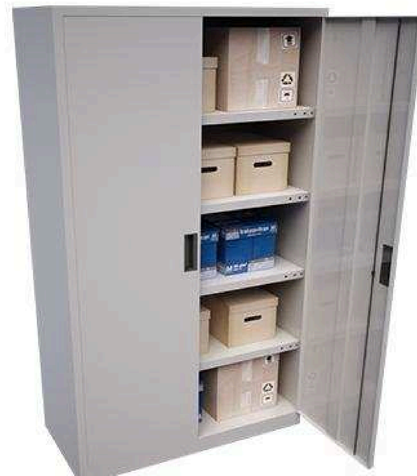
Armario con puertas abatibles