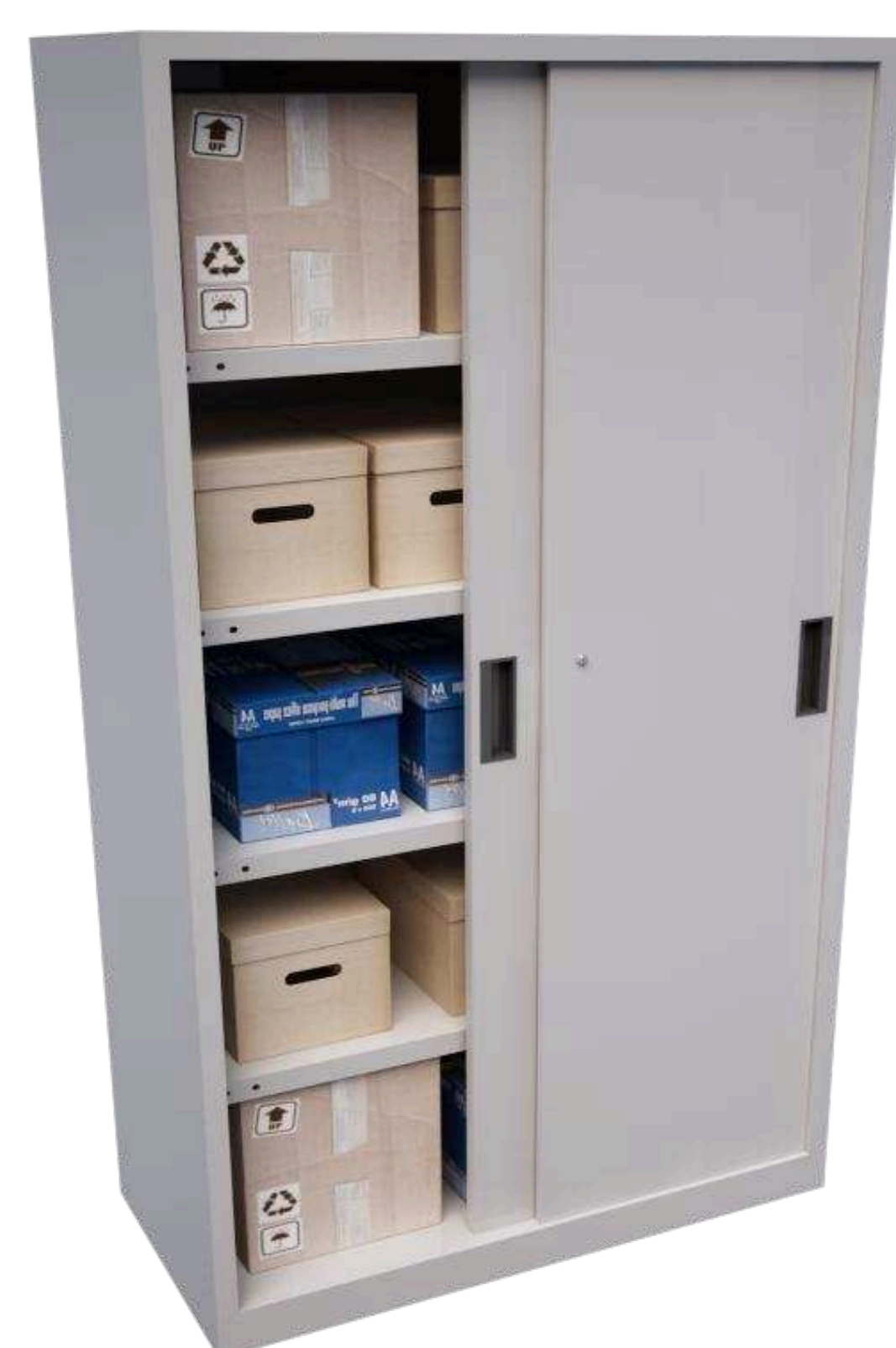
Armario con puertas correderas