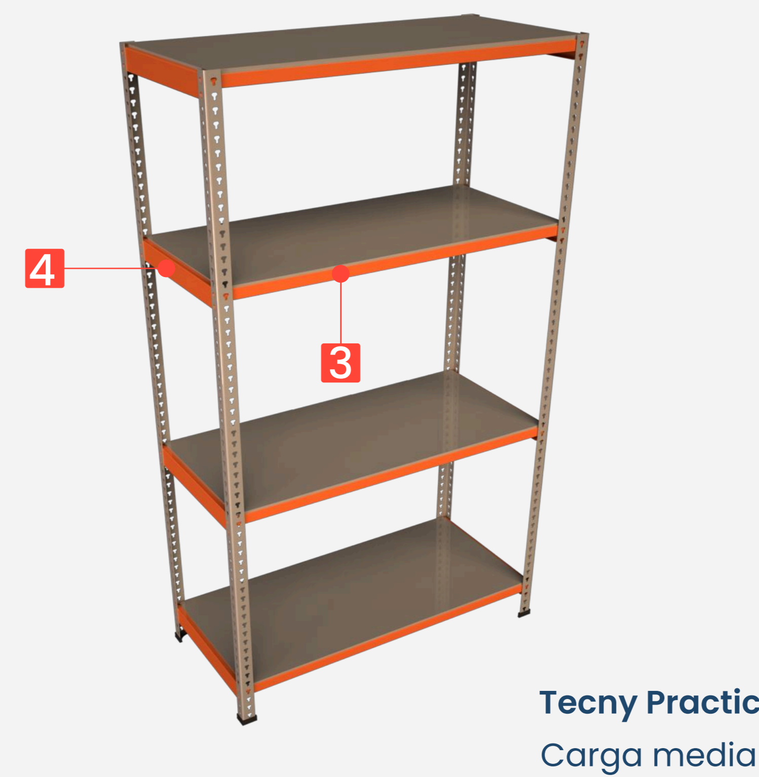
Tecny Practic Carga media