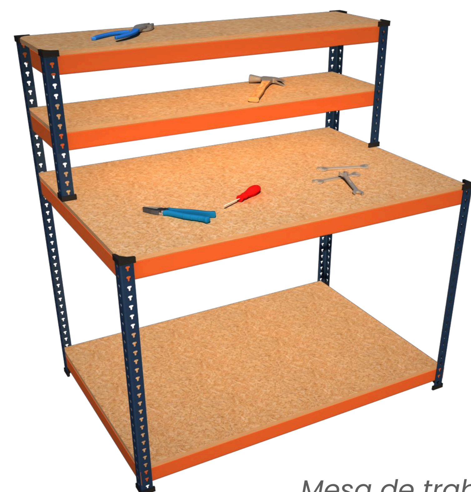
Mesa de trabajo

Escanea el código QR para saber más sobre las Mesas y Bancos de trabajo