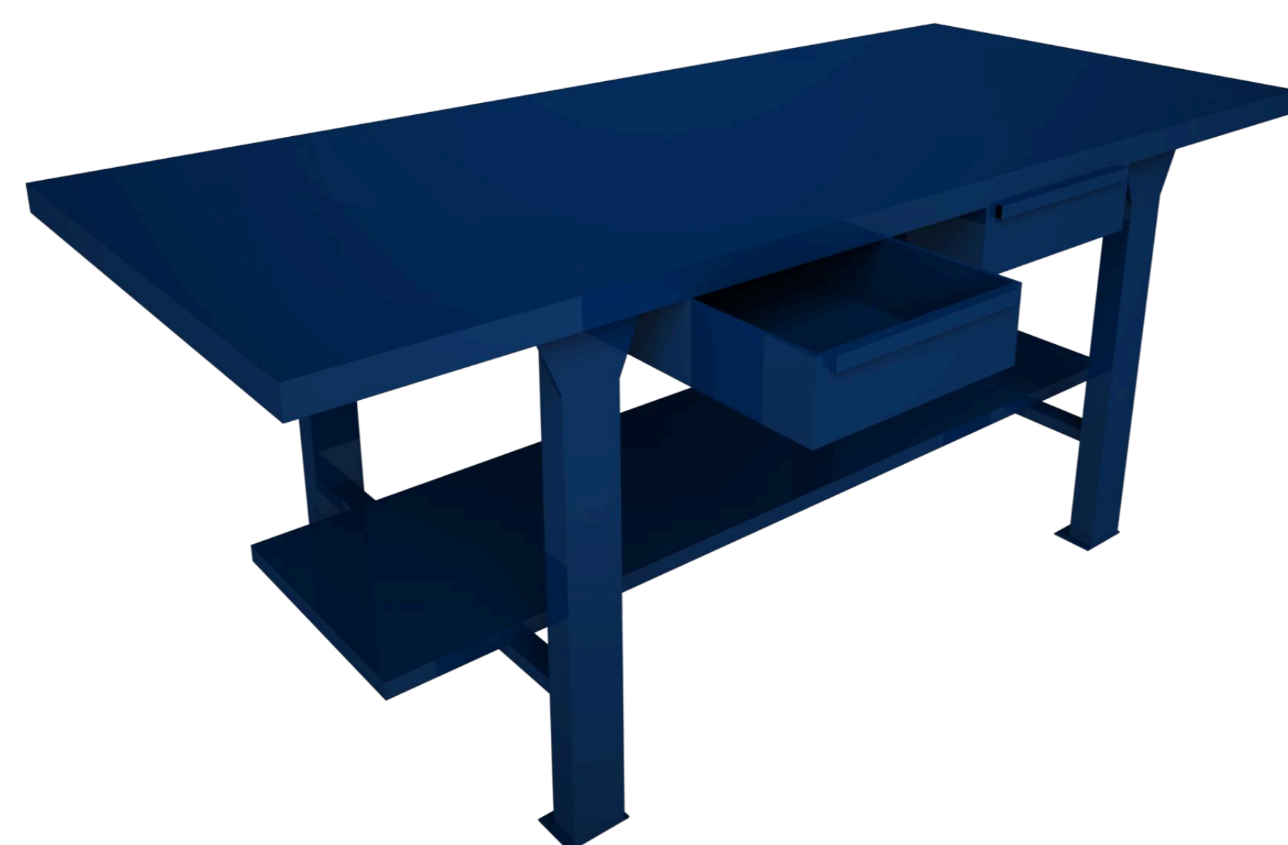
Banco de trabajo